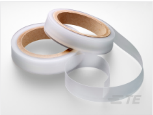
Núm. de pieza de TEEG8290-000 S1260-TAPE-3/4INX25FT-CL