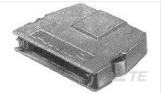
Núm. de pieza de TE5749195-2 68 50SR KIT,ST,UK