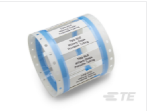
Núm. de pieza de TECAT-T3437-T548 Mangas de grado militar TMS-SCE