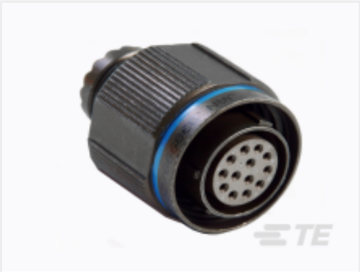
Núm. de pieza de TEYDTS26T15-19PAV001 PLUG ASSY