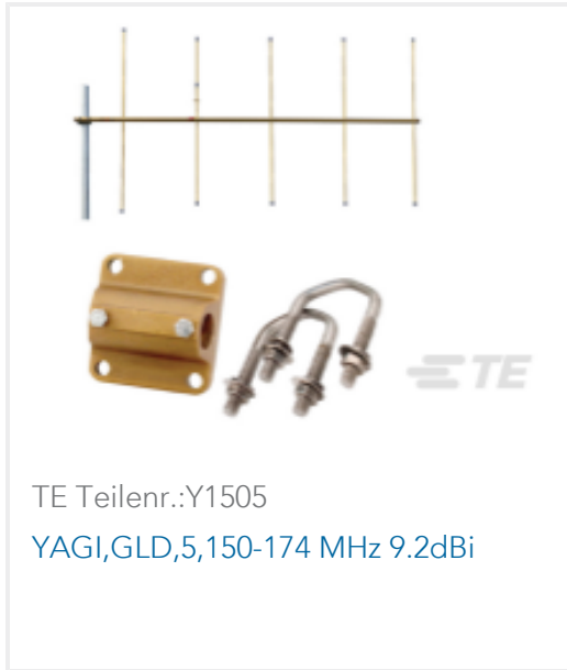
TE Teilnr.:Y1505 YAGI,GLD,5,150-174 MHz 9.2dBi