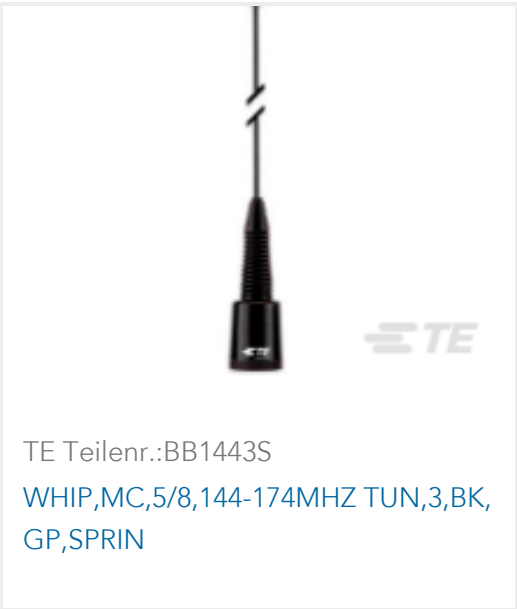
TE Teilnr.:BB1443S WHIP,MC,5/8,144-174MHZ TUN,3,BK, GP,SPRIN