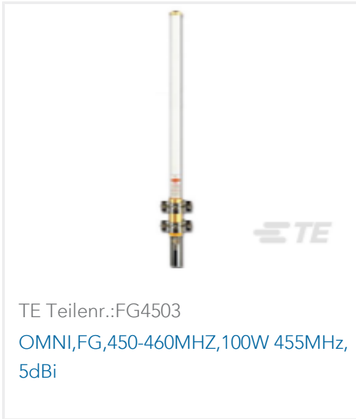
TE Teilnr.:FG4503 OMNI,FG,450-460MHZ,100W 455MHz, 5dBi