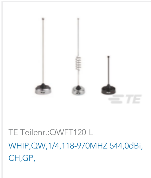
TE Teilnr.:QWFT120-L WHIP,QW,1/4,118-970MHZ 544,0dBi, CH,GP,