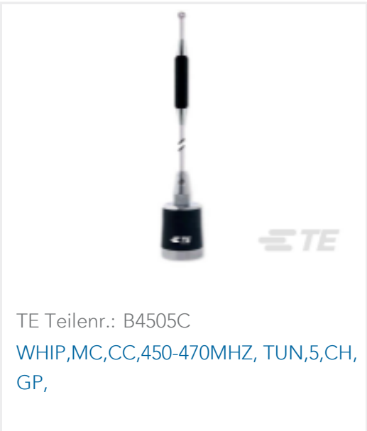
TE Teilnr.: B4505C WHIP,MC,CC,450-470MHZ, TUN,5,CH, GP,