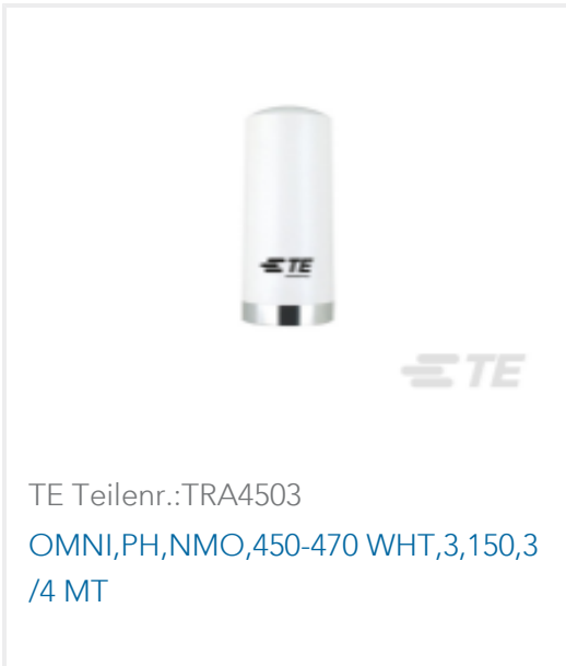
TE Teilnr.:TRA4503 OMNI,PH,NMO,450-470 WHT,3,150,3 /4 MT