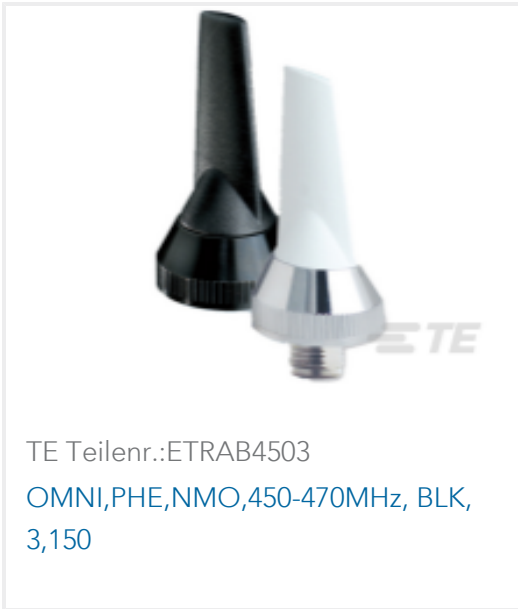
TE Teilnr.:ETRAB4503 OMNI,PHE,NMO,450-470MHz, BLK, 3,150