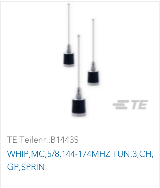
TE Teilnr.:B1443S WHIP,MC,5/8,144-174MHZ TUN,3,CH, GP,SPRIN