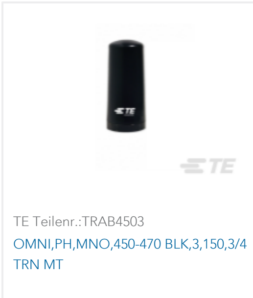
TE Teilnr.:TRAB4503 OMNI,PH,MNO,450-470 BLK,3,150,3/4 TRN MT