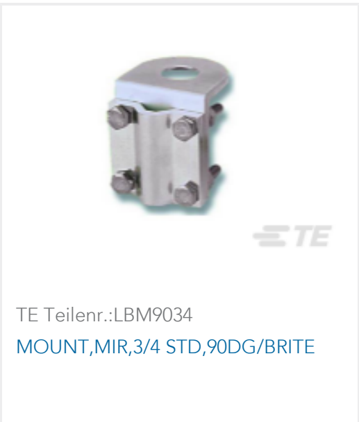
TE Teilnr.:LBM9034 MOUNT,MIR,3/4 STD,90DG/BRITE