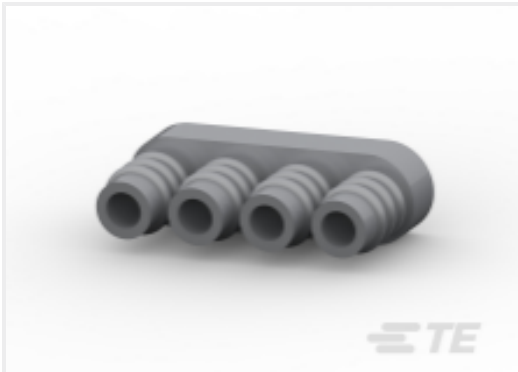
TE TEilenr.:2213782-4 UNIVERSAL MATE-N-LOK 4-PSN WIRE SEAL