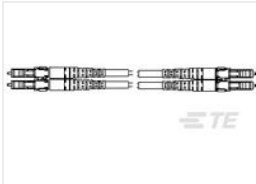
TE TEilenr.:2064915-3 C/A,F/O,2F I/O MM50 OM3,SCLC DPX