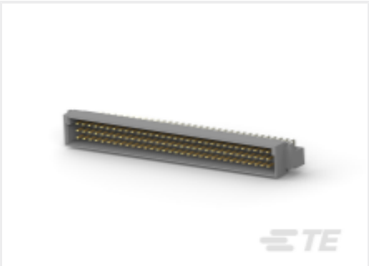
TE TEilenr.:650473-3 096 EURO TYPE C PIN ST ASSY