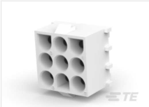
TE TEilenr.:2029002-1 09P UMNL HDR ASSY PC, NDH