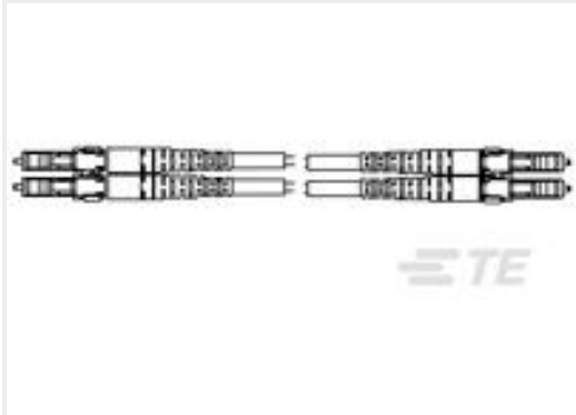
TE TEilenr.:2-2064915-5 C/A,F/O,2F I/O MM50 OM3,SCLC DPX