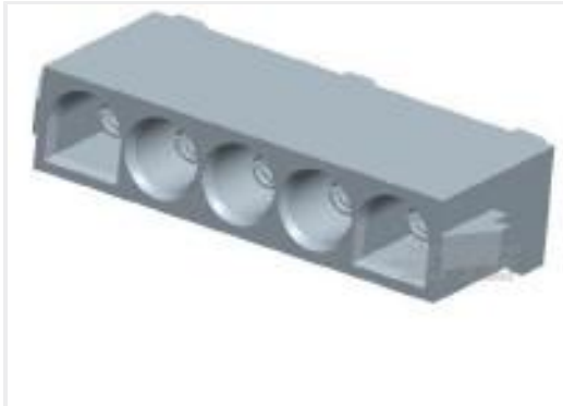
TE TEilenr.:2029361-1 05P UMNL SOC HDR V2 NATL NDH