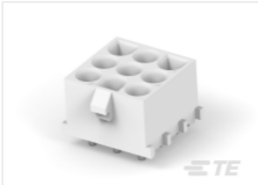
TE TEilenr.:5-2029002-1 09P UMNL HDR ASSY PC, NDH