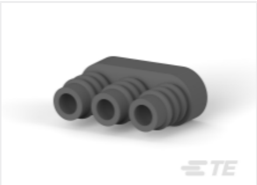
TE TEilenr.:2213782-3 UNIVERSAL MATE-N-LOK 3-PSN WIRE SEAL