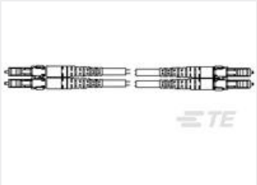
TE TEilenr.:2064915-8 C/A,F/O,2F I/O MM50 OM3,SCLC DPX, 8M