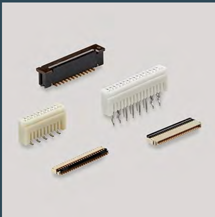
柔性印刷电路板 (FPC) 连接器