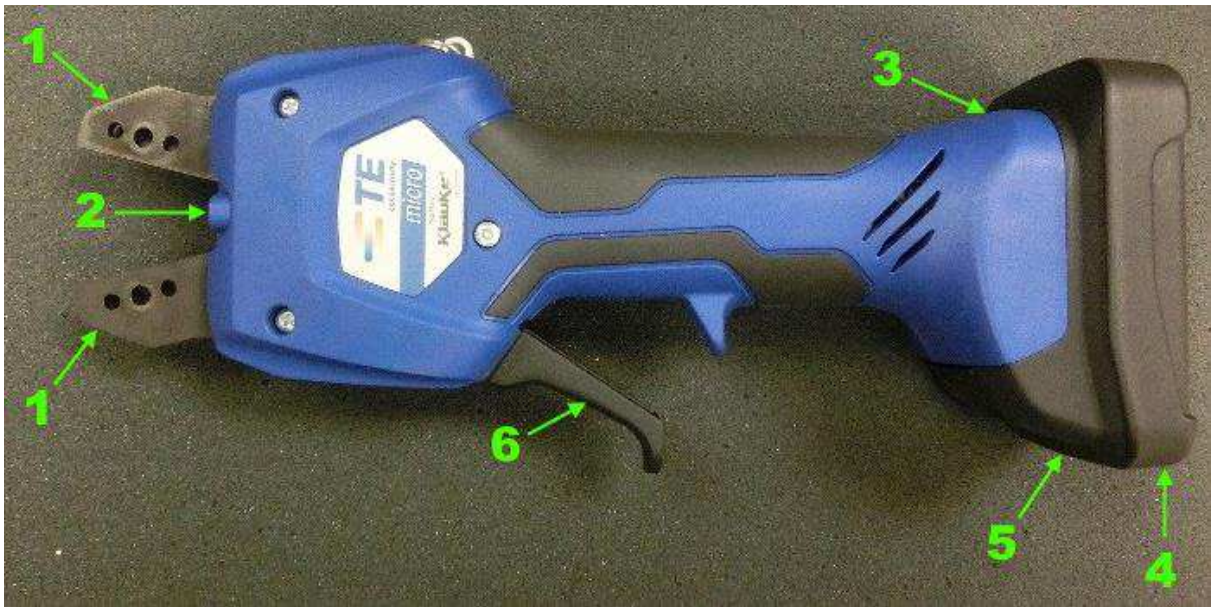
Obrázek 1: Sada krimpovacích nástrojů s nainstalovanou baterií