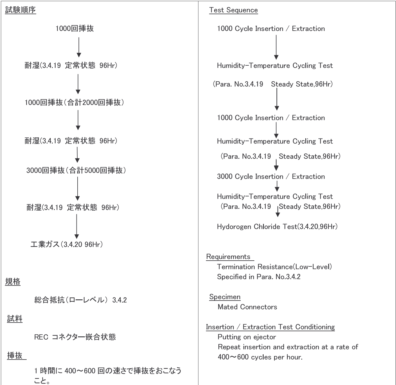
Fig.3 挿抜耐久性(オフィス外環境 5000 回) Fig.3 Durability Test (Harsh Environment)