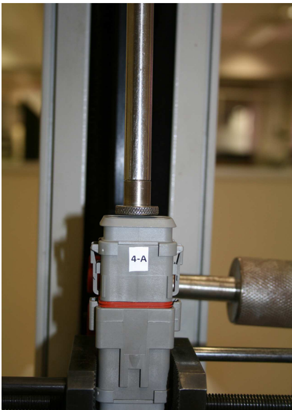
Foto 02 Conectada