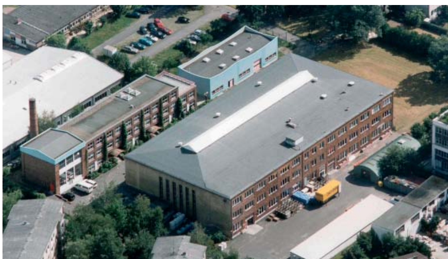
TE Connectivity Raychem, Entwicklung Berlin