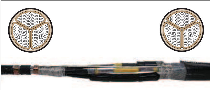
Кабель с экраном для каждой жилы